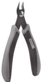
Art. Nr. 170688 SPEZIAL-SEITENSCHNEIDER

Vloeibare lijm in plastic-flacon met doseerbuisje om nauwkeurig te lijmen.